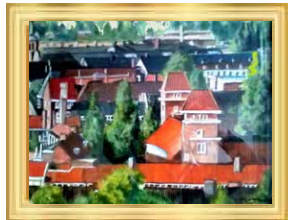
「アムステルダムのホテルの窓から」