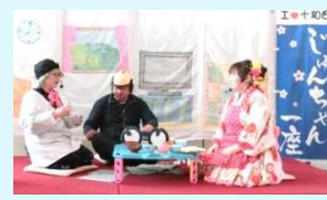
市民公開講座第1部 じゅんちゃん 一座寸劇「相棒～振り向けば君がいる 前見れば友がいる」