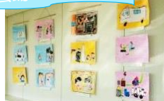
園児による絵画展