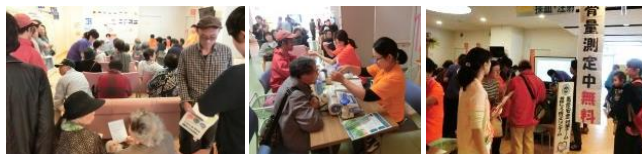
各体験・相談コーナーなど、院内は大盛況でした。たくさんのご来場ありがとうございました。