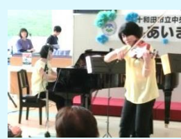
ナノハナ「バイオリン、フルート、ピアノ演奏」