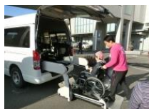
連携施設による福祉車両展示