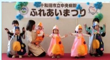
院内保育園「さわらびキッズルーム」ダンス「わあーお」