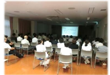
多くのスタッフにご参加いただきました。

当院は、二次救急告示病院として、日々多くの救急患者対応を行っており、救急車の応需率も大幅に向上してきています。去る8月22日に、当院救急室主催により、初めて十和田消防本部と合同で症例検討会を開催しました。具体的な事例をもとに活発な質疑と意見交換が交わされるとともに、今後も継続して開催していくことが確認され大変有意義な検討会となりました。