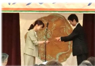
令和5年度目標達成診療科が発表され、循環器内科、及び、呼吸器内科が受賞し壇上にて表彰されました