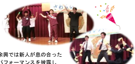
余興では新人が息の合ったパフォーマンスを披露し会場を大いに盛り上げました。