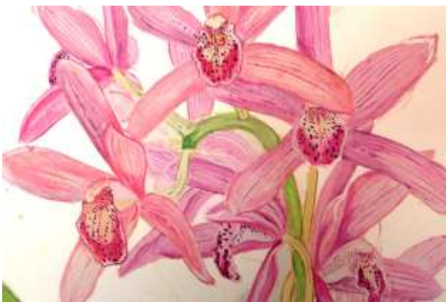
今月のアート「日差しがほしいな」 画 畑中 光昭